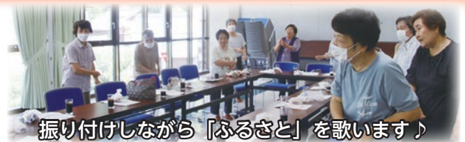
振り付けしながら「ふるさと」を歌います♪

取材したこの日は、4チーム対抗でカーレット大会が行われ、全員で大いに盛り上がりました。90歳を超える方々もおられますが、みんなとても仲良く、「声掛け、誘ってもらうことがとてもありがたい。」という声が聴かれました。