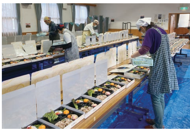
配食サービスなどにも使われています。

各地区の社協会長、民生児童委員、在宅福祉推進員、自治会、婦人会、老人クラブ、公共施設関係者、その他地域住民グループなどが中心となって、助成金や配分金を活用しながら、福祉活動に取り組んでいます。