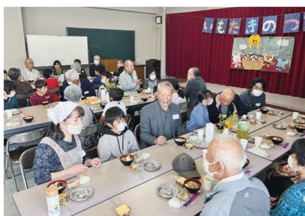
地域の子どもたちと高齢者がともに集う、交流活動などにも使われています。

地域ふれあい事業（会食・配食サービス）、独居高齢者のつどい、独居高齢者料理教室など様々な事業を実施しています。事業の内容は画一的ではなく、高齢者に限らず、子どもたち、障がいのある方、赤ちゃん、子育て中のお母さんなど対象者も地域の実情に合わせて独自に展開していて、さまざまな交流活動などの財源になっています。