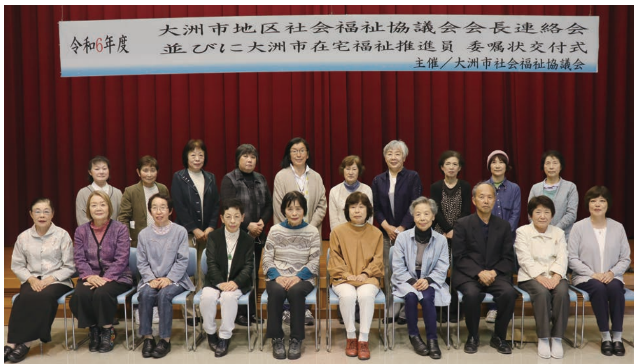
【令和6年度 在宅福祉推進員】 (敬称略) ※令和6年度新任

令和6年4月24日(水)、大洲市総合福祉センターにおいて、地区社協会長連絡会並びに在宅福祉推進員委嘱状交付式が開催され、在宅福祉推進員の皆様に委嘱状が交付されました。