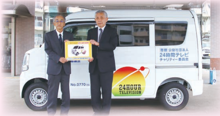
南海放送株式会社様から大洲市社協への贈呈式にて

令和6年3月12日(火)に、24時間テレビチャリティー委員会様から、訪問入浴車を寄贈していただきました。この車両は、入浴に必要な浴槽やボイラーなどを搭載した軽自動車で、大型車での訪問が難しい山間部や道幅が狭い場所などでの活躍が期待されています。