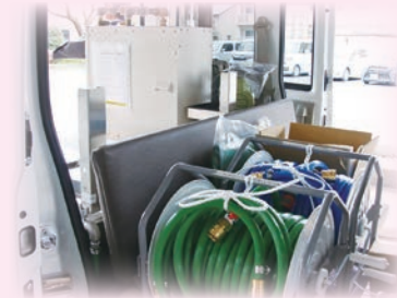
ボイラーやホースなどをコンパクトに搭載

全国の皆様から寄せられた善意ある募金で購入して寄贈していただいた車輛です。更なる福祉サービス向上につながるよう大切に活用させていただきます。