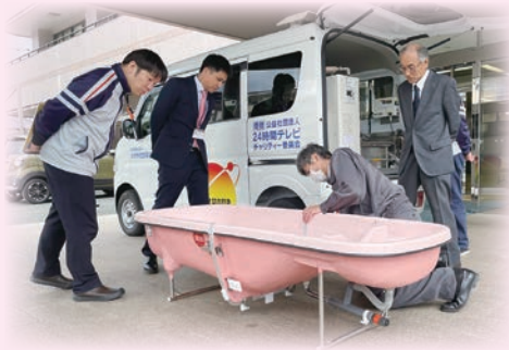
軽量で遠赤外線塗装の浴槽を搭載